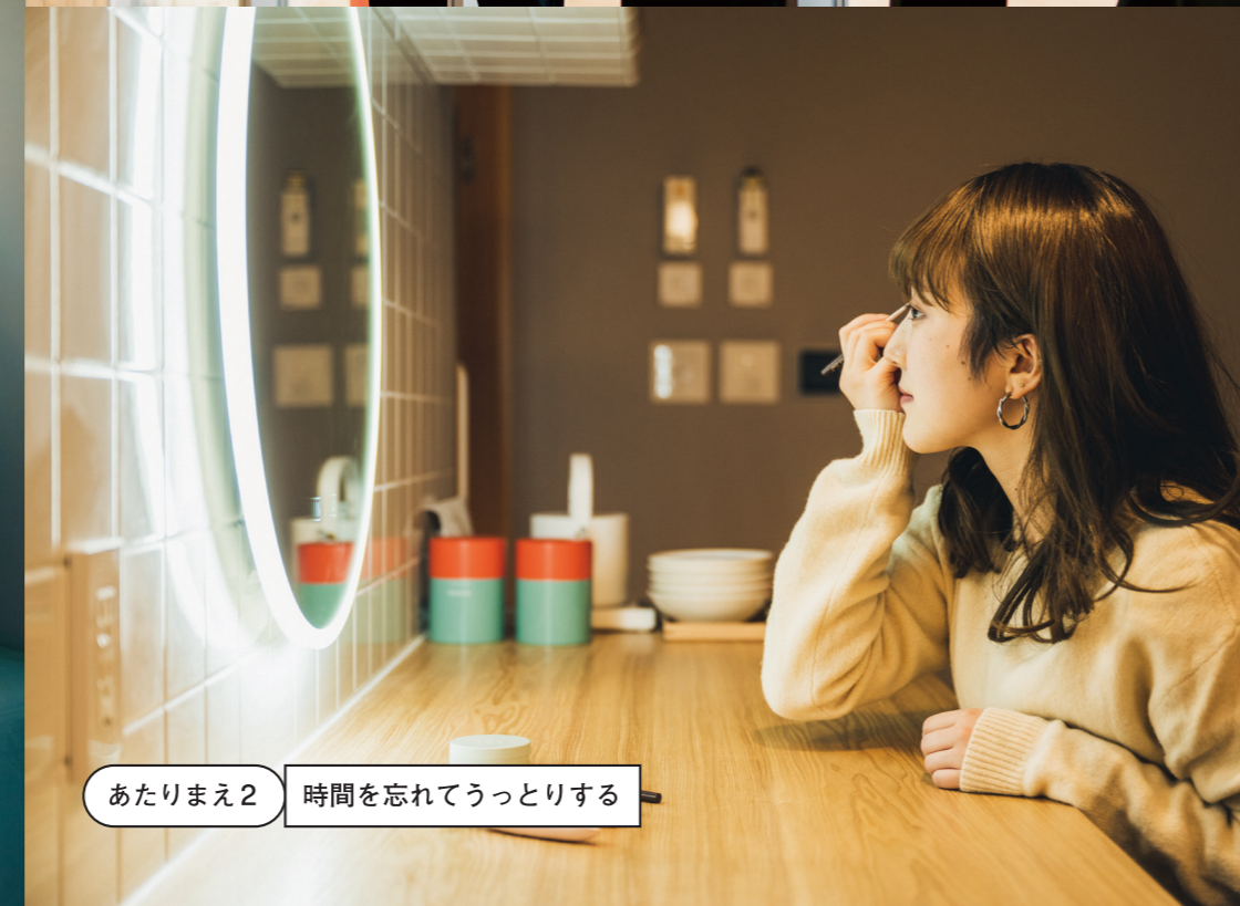
あたりまえ2 時間を忘れてうっとりする