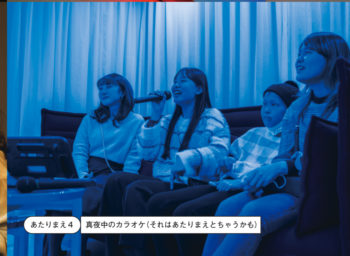
あたりまえ4 真夜中のカラオケ(それはあたりまえとちゃうかも)