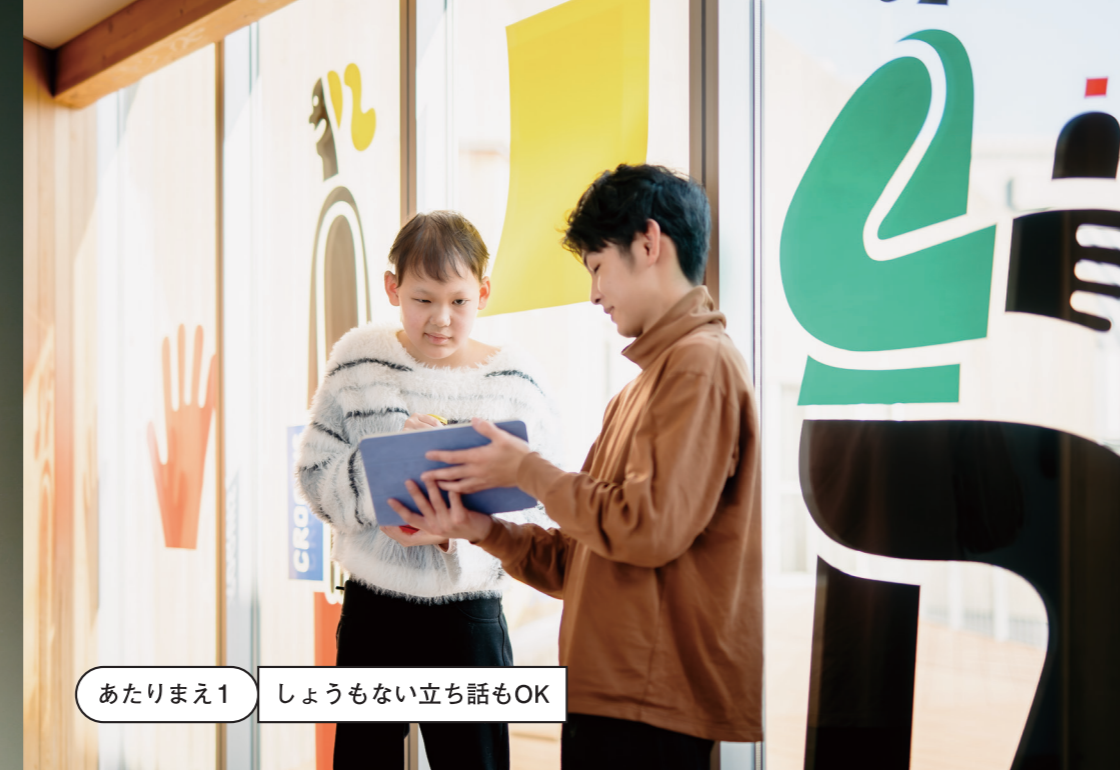
あたりまえ1 しょうもない立ち話もOK