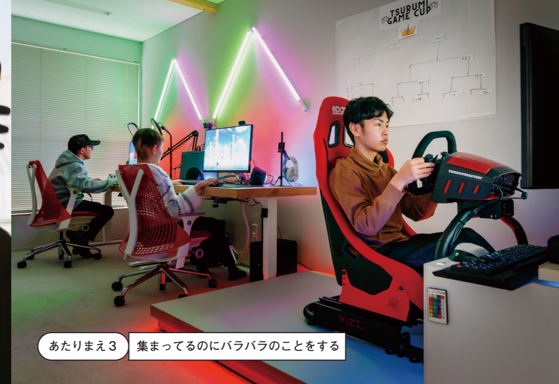
あたりまえ3 集まっているのにバラバラのことをする